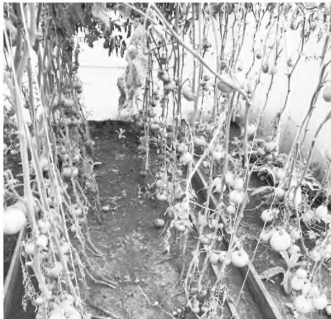
Как так можно выращивать помидоры, что листьев нет, а плодов много...