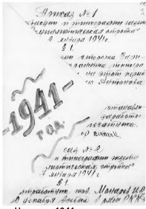
Начался 1941 год

За три-четыре таких нарушения следовало увольнение «прогульщика». Если опоздание превышало 20 минут, сотрудник лишался работы.