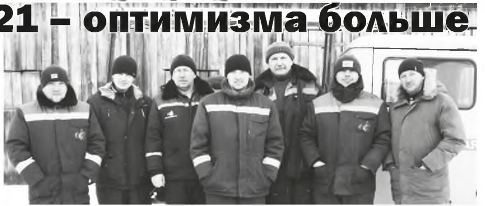
Бригада «Облкоммунэнерго» к выезду готова

- Разумеется. У нас много текущей работы по обслуживанию оборудования и сетей. В связи с нововведением с 1 июля прошлого года по установке счетчиков работы добавилось. Напомним, что теперь жители не имеют право сами устанавливать приборы учёта, а обязаны подать заявку нам или в ЦЭС. Увеличилось примерно в два раза и количе-