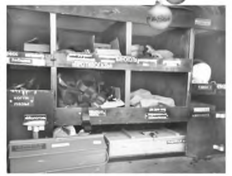
Хранение спец.оборудования в машинах удивляет продуманностью