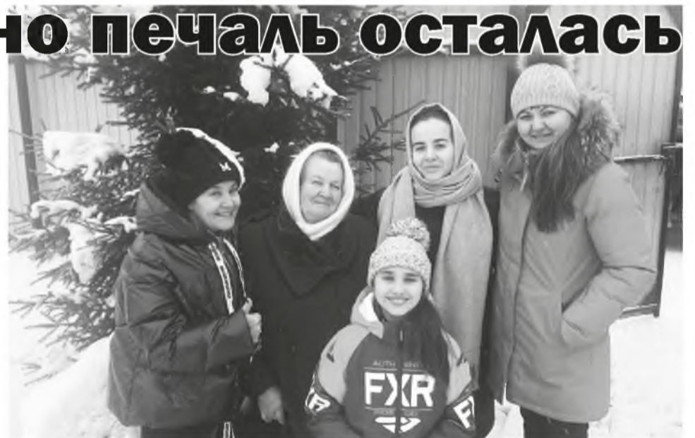
Дочерьми и внуками семье можно гордиться

- Вы знаете, какая у меня доброжелательная кошка Соня? - выплещивает хозяйка. - Сядет около меня, а я читаю. Много читаю, люблю «Сельскую новь». Благодарна редакции за поддержку в трудные времена. Очень люблю статьи про хороших людей, о которых пишете. Про врачей, учителей - есть же хорошие люди. Приятно, что пишут в газете про ветеранов. Мне всё нравится, даже реклама нужна для жизни.